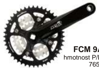
FCM 9A hmotnost P/L: 765g