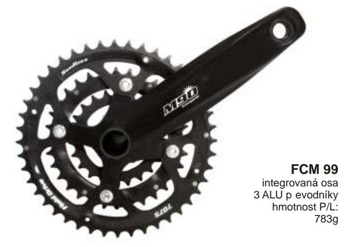
FCM 99 integrovaná osa 3 ALU p evodníky hmotnost P/L: 783g