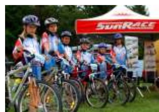
"Z" bike team MTB team