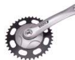
Kliky FCS 320