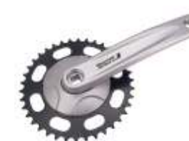
Kliky FCS 500