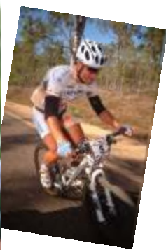
Crocodile Trophy 2008