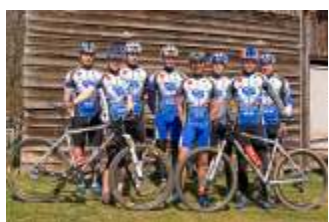
SPSVD Jistebnice MTB team