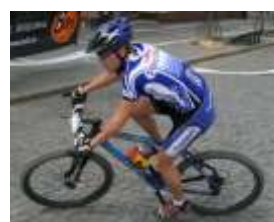
Pitrs bikes team MTB team