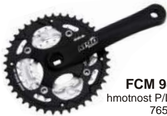
FCM 94 hmotnost P/L: 765g